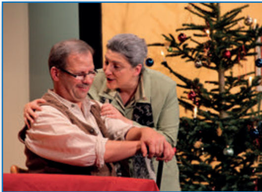
Saison 2012/2013 - D' Katz muss weg