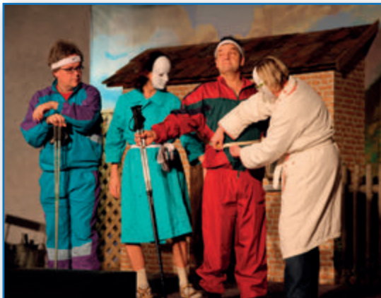
Saison 2015/2016 - Das verflixte Klassentreffen