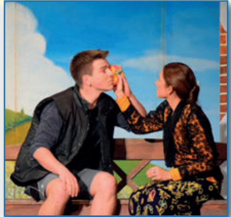
Saison 2022/2023 - Allein unter Kühen