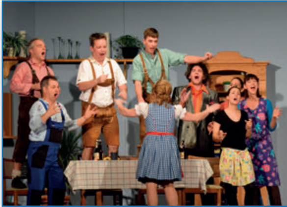
Saison 2016/2017 - Männer haben's auch nicht leicht