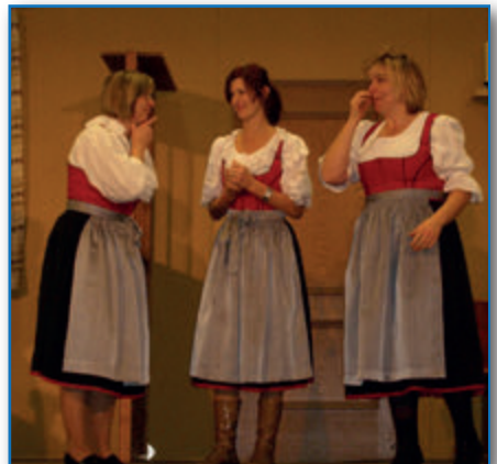
Saison 2008/2009 - Schützenfest in Dinkelhausen