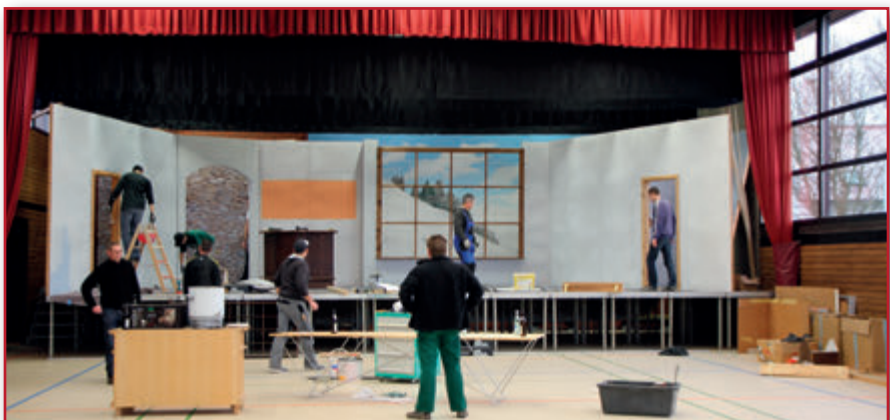
Bühnenaufbau Saison 2016/2017 - Die Damen vom Gasthof „Schwanen“